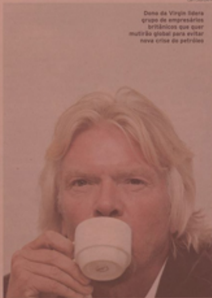
Dana da Virgin Idena grupo de empresários britânicos que quer mudar o Brasil para evitar nova crise de petróleo

Cerca de 28 tipos de fruta da Paraíba estão proibidas de entrar no mercado pernambucano. A agência de defesa agropecuária do Estado vetou o ingresso de caqui, limão, uva, manga e outras frutas, por causa da praga da mosca-negrinha-órfão. Pernambuco teme que a peste chegue ao polo de frutas tipo exportação do Vale do São Chico.